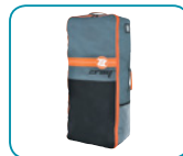
Bolsa de transporte