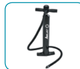
Bomba de alta presión