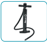
Bomba de alta presión