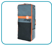
Bolsa de transporte