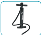
Bomba de alta presión