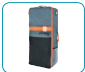
Bolsa de transporte