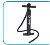
Bomba de alta presión