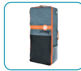
Bolsa de transporte